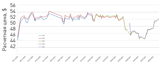
Рисунок 2 Динамика изменения расчетной цены по двум ближайшим сериям фьючерсов на СПБМТСБ